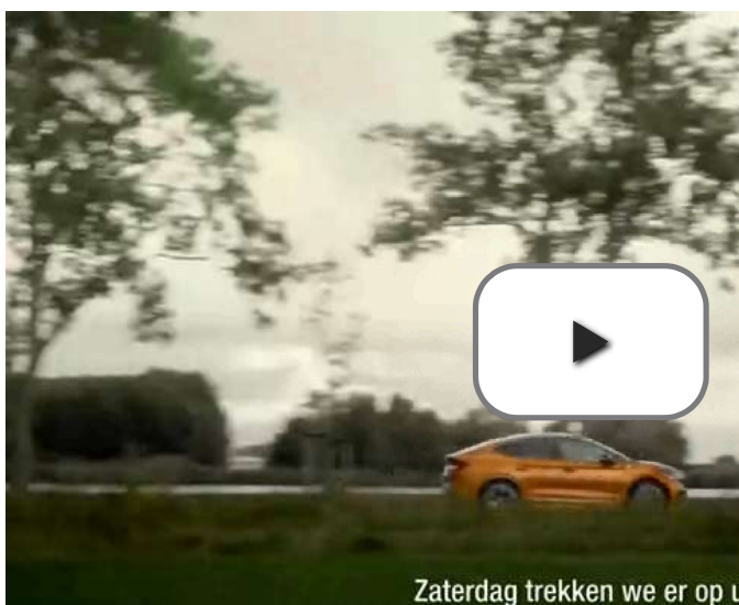
Zaterdag trekken we er op u

afgelopen jaren honderden auto's konden parkeren - na de sloop van de panden van onder meer asfaltcentrale Bruil, veevoederbedrijf IJsselbron en Asbestona - verrijzen nu de eerste van 193 woningen in het project Ons Stadsgezicht. Daar doen ze iets bijzonders met het regenwater.