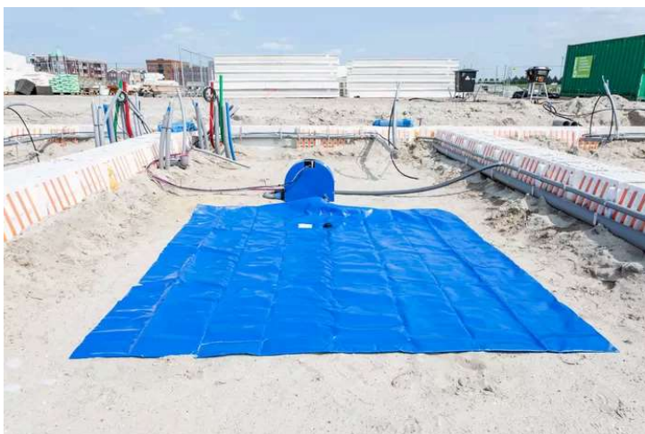
▲ © Joosten Groep

Te veel regen wordt via de tuin en ondergrondse buizen, net als regenwater in de straten, afgevoerd naar de zogenoemde parkeercoffer: de grote parkeerplaats, met daaronder speciaal drainagezand om het regenwater in de bodem te laten zakken.