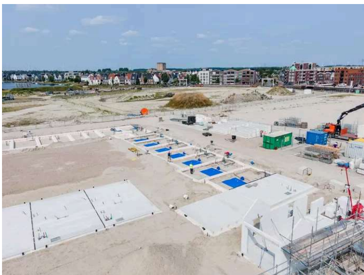
▲ De waterzakken liggen in de kruipruimtes onder de woningen.

Nu komen de rubberen waterzakken in de kruipruimtes van de 193 woningen, waarvan een deel in appartementenblokken. Veel is er niet van te zien. Op bepaalde dagen worden enkele